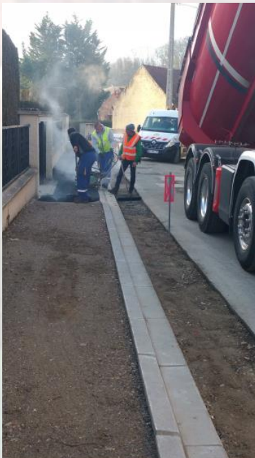
Pose de l'enrobé