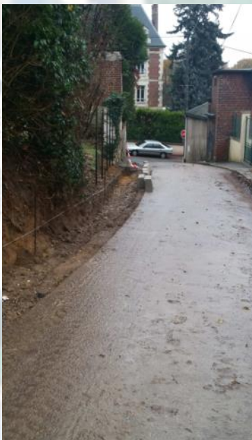
Préparation du bord de la route avant la pose des bordures

La rue des groseilliers a été aménagée à la fin de l'année dernière pour permettre la modification des sens de circulation du quartier rue du Mesnil- rue des groseilliers. Une analyse du comportement des automobilistes va être réalisée avant de compléter le cas échéant l'aménagement de cette rue par l'installation de potelets pour limiter la gêne occasionnée par le stationnement sur trottoir ou encore la pause de ralentisseurs pour limiter la vitesse dans cette zone qui va aussi passer à 30 Kms/h