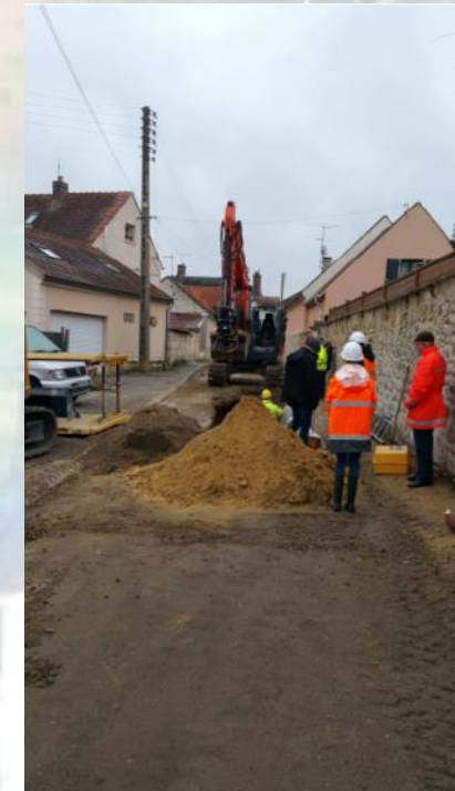
Réunion de chantier du lundi