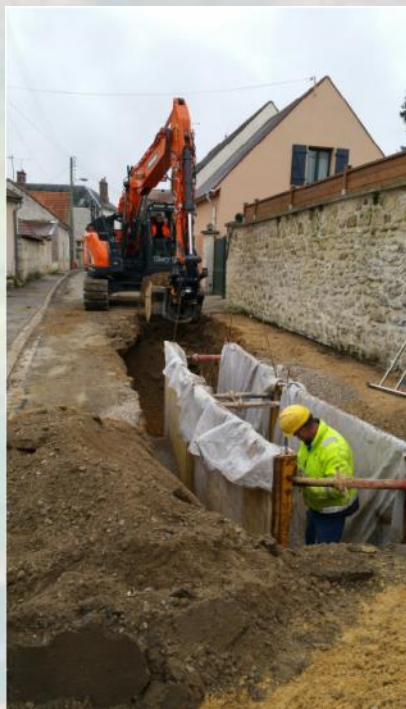
Rue Blossier – Ouverture de la chaussée pour la pose de la canalisation

Les travaux de séparation des eaux pluviales et des eaux d'assainissement ont commencé au début du mois de janvier 2019 rue Iser SOLOMON et vont se poursuivre jusqu'à la fin du mois de juillet 2019 jusqu'en haut de la rue Bamberger. En cette fin du mois de février, les travaux se poursuivent dans la rue Blossier qui sera entièrement rénovée dès la fin des travaux de séparation des pluviales. Nous étudions également la possibilité de remplacer les canalisations d'eau de ville dans cette rue, les négociations se poursuivent avec le syndicat des eaux de Fresne-Léguillon. Ces travaux de séparation des pluviales vont démarrer au début du mois de mars dans la rue Bamberger, puis viendront ensuite les travaux de remplacement des canalisations d'eau et enfin l'enfouissement des réseaux électriques.