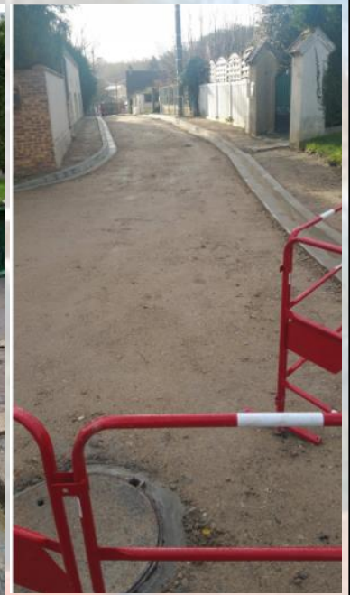
Reprise du fond de forme