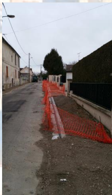
Pose du fil d'eau et des bordures