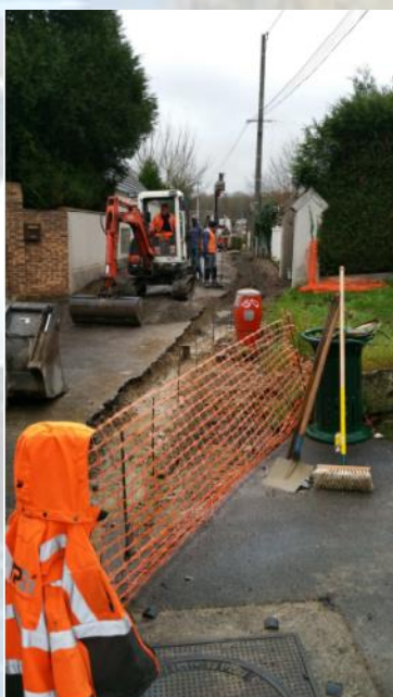
Pose des bordures