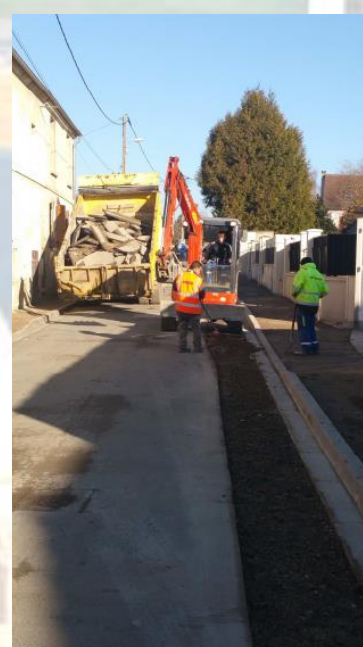
Préparation pour la pose de l'enrobé