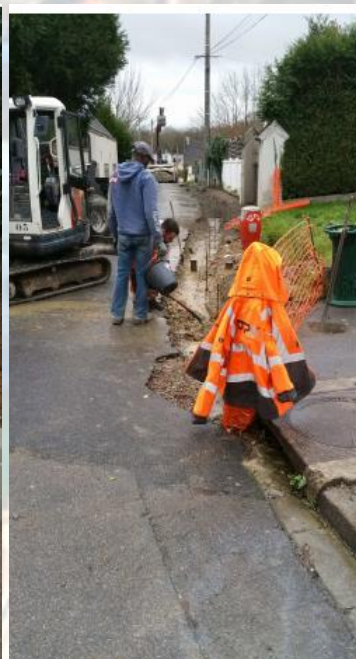
Élargissement du trottoir à l'entrée du village