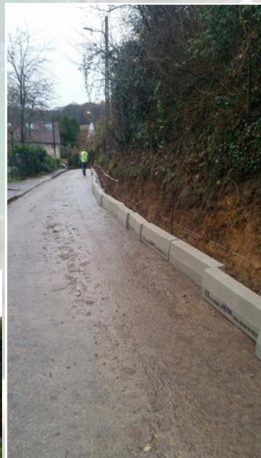
Epaulement du talus et élargissement de la route jusqu'à l'alignement