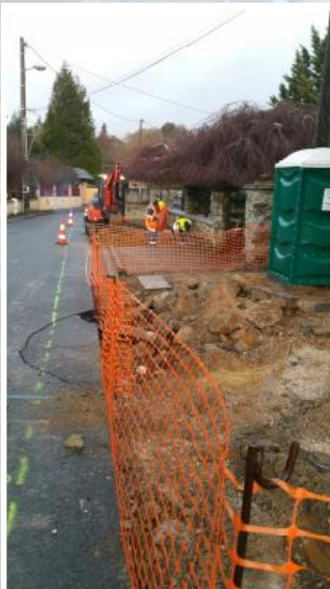
Elargissement du trottoir à l'entrée du village

Les travaux commencés en décembre 2018 rue du Mesnil se poursuivent et devraient se terminer vers la mi-mars. Un trottoir aux normes PMR (Personnes à Mobilité Réduite) a été construit côté impair de la rue et le trottoir côté pair a été réparé avec la mise en place d'un nouvel enrobé. Cette rue est maintenant en sens unique et va passer en zone 30. Nous vous rappelons que les trottoirs sont réservés exclusivement aux piétons et non au stationnement des voitures. Les places de stationnement seront matérialisées par un marquage au sol complété par une signalisation verticale.