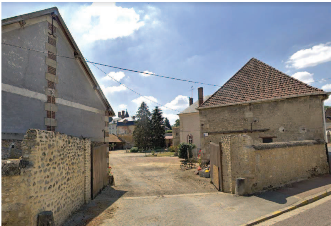
Entrée nord (rue de Méru)