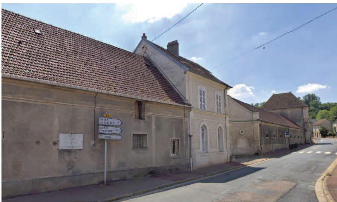
Vue depuis la rue Bamberger