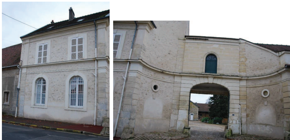
Entrée sud (rue Bamberger)